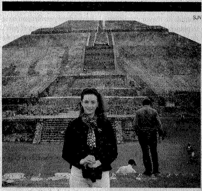
Casiez de ciudadanía francesa es acusada de secuestro, entre otros delitos.

Calderón abordó el tema de la seguridad en los distintos actos públicos y entrevistas con medios en Veracruz, Zacatecas y Nuevo León, incluso en Monterrey revisó en privado la agenda de seguridad con el gobernador Rodrigo Medina y cinco empresarios regionales, acto que fue omitido incluso de la agenda presidencial.